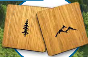
Holzbrettchen mit Harzmotiven