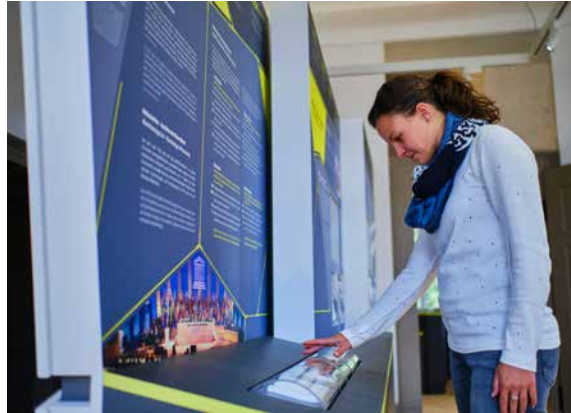
Welterbezentrum Walkenried

Das Welterbe-Infozentrum in Walkenried bietet einen Überblick über das UNESCO-Welterbe im Harz und dessen 3.000-jährige Kulturgeschichte. Zugleich ist mit dem barrierearmen Infozentrum erstmals ein Ort entstanden, der den außergewöhnlichen universellen Wert der Welterbestätte „Bergwerk Rammelsberg, Altstadt von Goslar und Oberharzener Wasserversorgung“ vermittelt. Mehr noch: Die Ausstellung verdeutlicht auch die Bedeutung von UNESCO-Welterbestätten für die gesamte Weltgemeinschaft. Denn das Welterbe gehört allen Menschen und verbindet sie grenzüberschreitend miteinander.