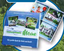
Spaßiges Harz- Memory