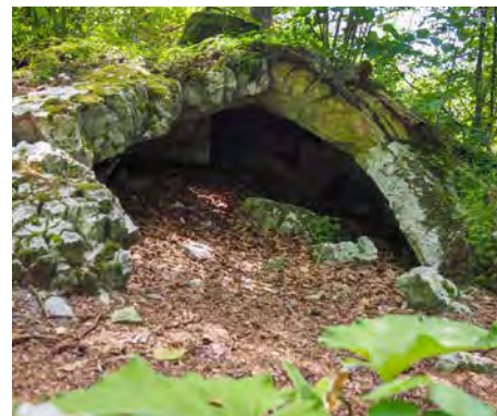
Zwergenhöhlen in Bad Sachsa

Der zertifizierte Natur- und Landschaftsführer Lorenz Wilms bietet im Gipskarstgebiet um Bad Sachsa Naturführungen an. Während der Führung geht es in den Lebensraum des Bibers und die Teilnehmer erfahren vieles über dieses erstaunliche Tier. Anschließend führt der Weg zu den Zwerghöhlen mit spannenden Erklärungen zu deren Entstehung. Die Naturführungen dauern ca. 2,5 bis 3 Stunden und finden bei jedem Wetter statt. Mindestens 4 bis maximal 10 Teilnehmer pro Tour möglich. Preis nach Vereinbarung. Terminvereinbarungen sind unter LorenzWilms@mail.de oder telefonisch unter 0173-964 2333 möglich.