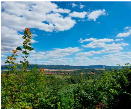
Stempelstelle „Ellricher Blick“

Wandern Sie durch die schöne Natur im Südharz und sammeln Sie bis zu 13 offizielle Stempel der Harzer Wandernadel direkt bei uns in Bad Sachsa und seinen Ortsteilen Neuhof und Steina sowie in Walkenried, Wieda und Zorge.