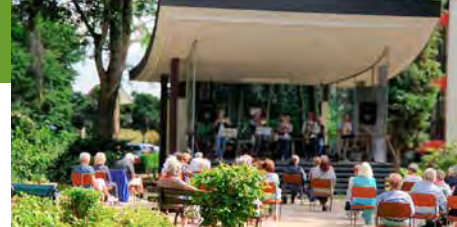
Konzertsommer Bad Sachsa